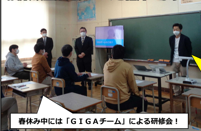
春休み中には「GIGAチーム」による研修会！

当初は、学校内のネットワーク整備と1人1台端末の整備を令和5年度をめどに進める予定でしたが、感染症や災害発生等による学校の臨時休業等の緊急時においてもICTの活用により、子供たちの学びを保障できる環境を早急に実現するため、整備が前倒しになり、昨年度までに完了し、全児童分のタブレット端末が揃いました。