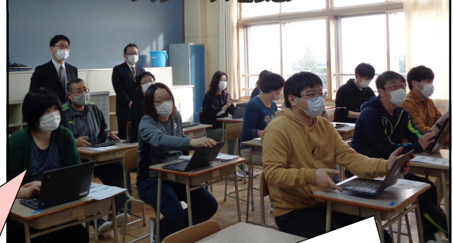
先生方も「ChromeBook」に慣れていきます！