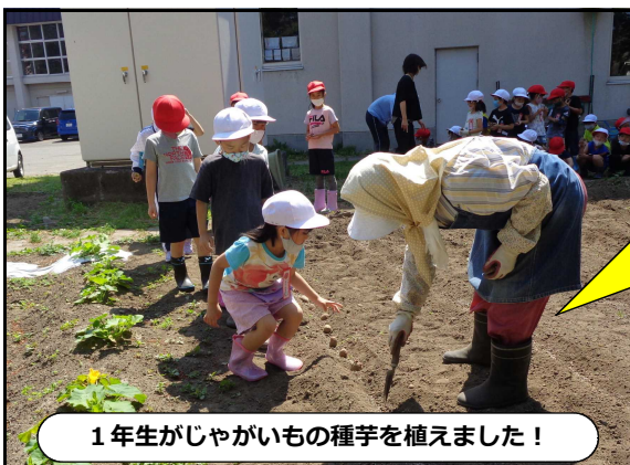
1年生がじゃがいもの種芋を植えました!