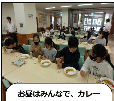
お昼はみんなで、カレーライスを食べました。

科学実験の「ろうそく実験」「ミクロ生物を探しだそう」「化石を楽しむ」「コイン選別機作り」、そして「プラネタリウム&工作」の5つのなかから興味のある2つを選んで学習してきました。