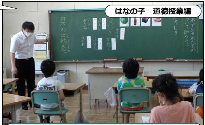
はなの子 道徳授業編

反対に、日本の伝統文化を尊重することは、ものを大事に使い自然と共生できるような生き方を探ることにつながります。日本の伝統や文化を尊重することは、そこに良さを発見することです。今回の授業が、手軽さや便利さといった面に偏りがちな価値観を捉え直す機会となりました。