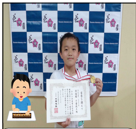
令和3年度 帯広市学年別珠算大会 個人総合競技 小学〇年の部 準優勝 ○○ ○○ さん