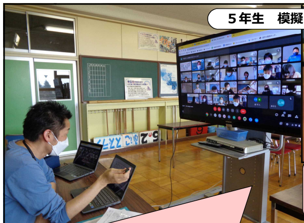
5年生 模擬リモート授業