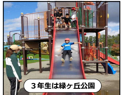
3年生は緑ヶ丘公園