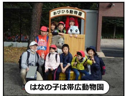
はなの子は帯広動物園