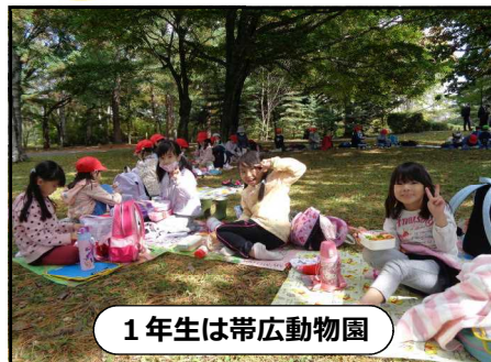
1年生は帯広動物園