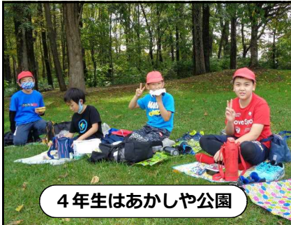
4年生はあかしや公園