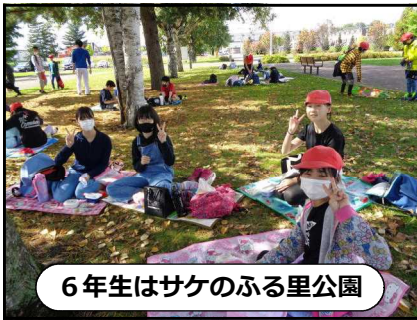
6年生はサケのふる里公園

緊急事態宣言発令での延期につぐ延期、そして前日から降る雨を恨んでしまうほどでしたが、みんなの「遠足に行きたい!」という願いが通じたのか 子供たちが待ちに待った遠足を実施することができ、正直ほっとしました。