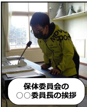
保体委員会の 〇〇委員長の挨拶

保護者の皆様、朝早くからのお弁当づくり、ありがとうございました。お昼の美味しいお弁当が、子供たちの元気の源となりました。