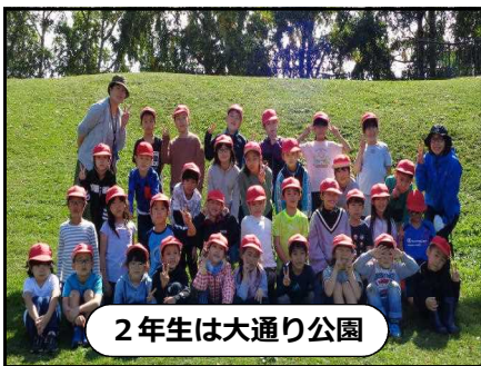
2年生は大通り公園