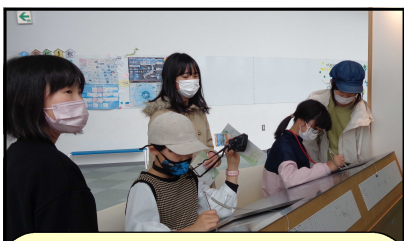
釧路市子ども遊学館 体験学習をたっぷり!

6年生の教室をのぞいて見ると・・・「修学旅行を成功させるために」と書かれた子供たち一人一人の目標が黒板を埋め尽くしていました。目標どおりに、学級としての絆を深め、どの子も充実した二日間となりました。