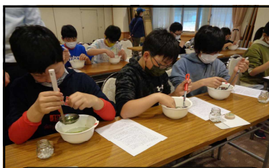
阿寒にてマリモ作り体験 お土産にしました!