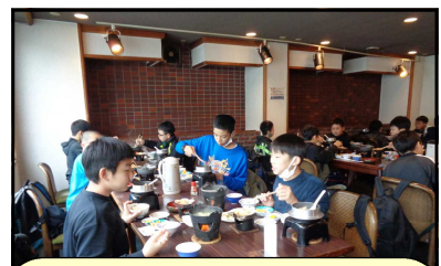
ご飯をたくさん食べて 次の活動に備えます!